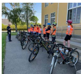
Radfahrprüfung der 4. Klasse