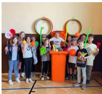
Geschenk des ÖFB: Spieltonne im Rahmen der BFV Vereinstour