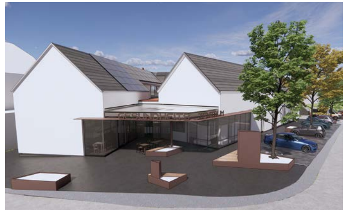
Visualisierung: So soll das Gesundheitszentrum ausschauen.