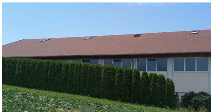
Die 4 Dachflächenfenster ermöglichen eine bessere Wärmeableitung.