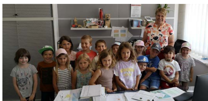
Auch ins Büro der Bürgermeisterin durfte die Kindergartengruppe einen Blick werfen.