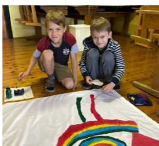
Special Olympics Fahne