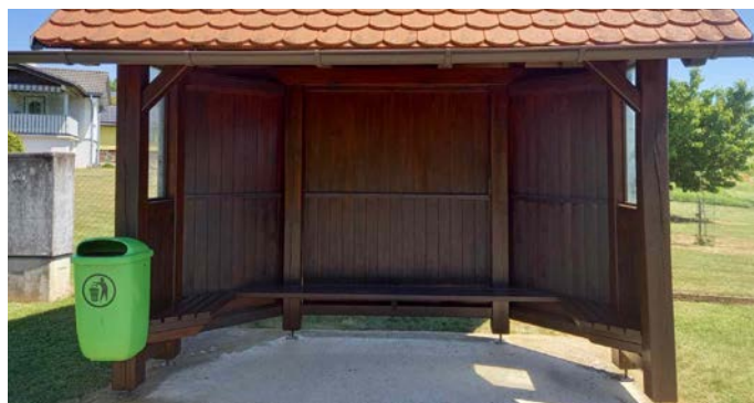
Schaut wieder aus wie neu: Das Bushaltehäuschen am Mitterberg in Rohrbrunn