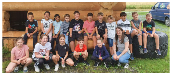
Abschluss-Ausflug in den Gaudi-Park nach Zahling