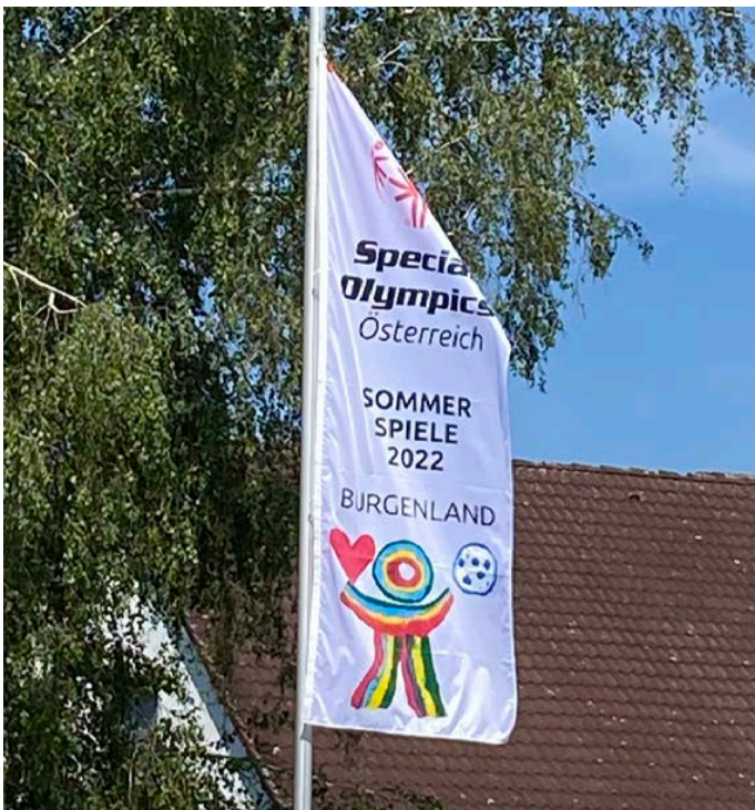
Die Special Olympics Fahne wehte Ende Juni in unserem Ort und setzte ein Zeichen für Verbundenheit und Unterstützung.