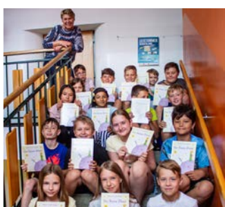
Ein Geschenk der Gemeinde zum Abschied für die 4. Klasse.