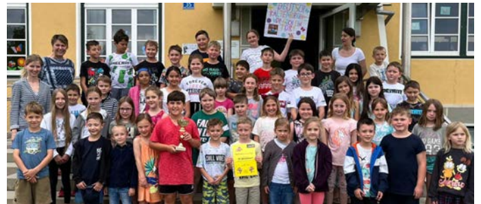
„Deutsch Kaltenbrunn vor, noch ein Tor!“ war das Motto.