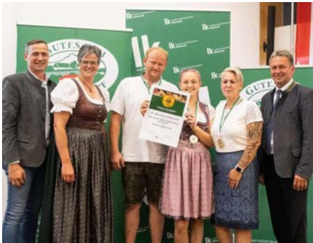
... zur Gold-Auszeichnung und 2 Prämierungen bei der Steiri- schen Spezialitätenprämierung: Himlische Spezialitäten