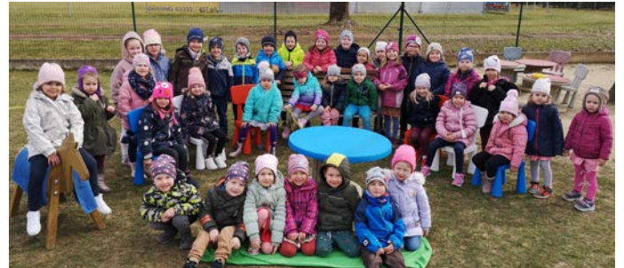
Spende der Sängerrunde DK: Neue Gartenmöbel