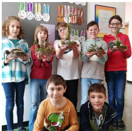
SchülerInnen bastelten Osterkrippen