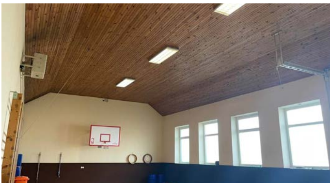
Neue Basketballkörbe und Deckenbeleuchtung im Turnsaal

Im Turnsaal des Kindergarten- & Volksschulgebäudes wurde die Deckenbeleuchtung auf eine sparsame und leistungsstarke LED-Technologie umgestellt und die Basketballkörbe saniert.