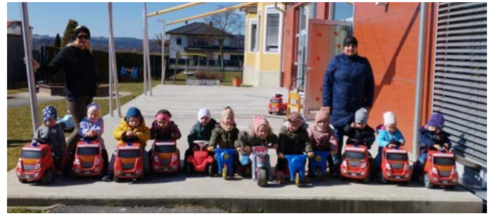
Viel Freude machen die gesponserten Bobby-Cars