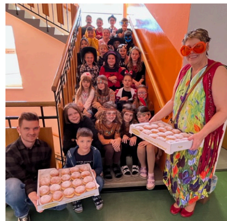
Krapfenjause für alle